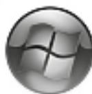
Windows Vista Windows 7