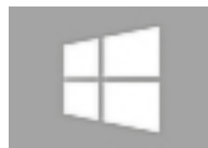
Windows 8 Windows 10